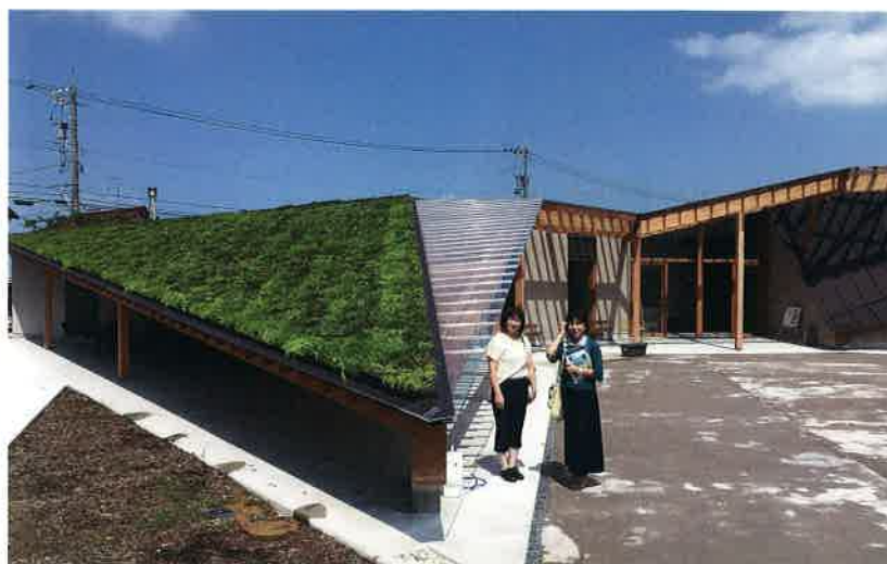
グリーンの屋根が瑞々しいモダンな建物は 新国立競技場を手掛けた隈 研吾さんの設計です