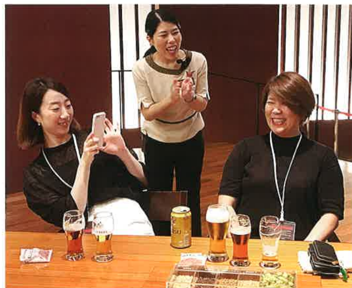
できたてのビールを飲みくらべしました (ニューハーフの(ん?)ニューフェイスの堀)