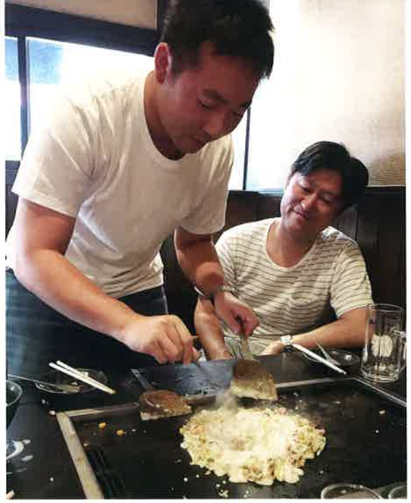
くは もん にし きか (池)