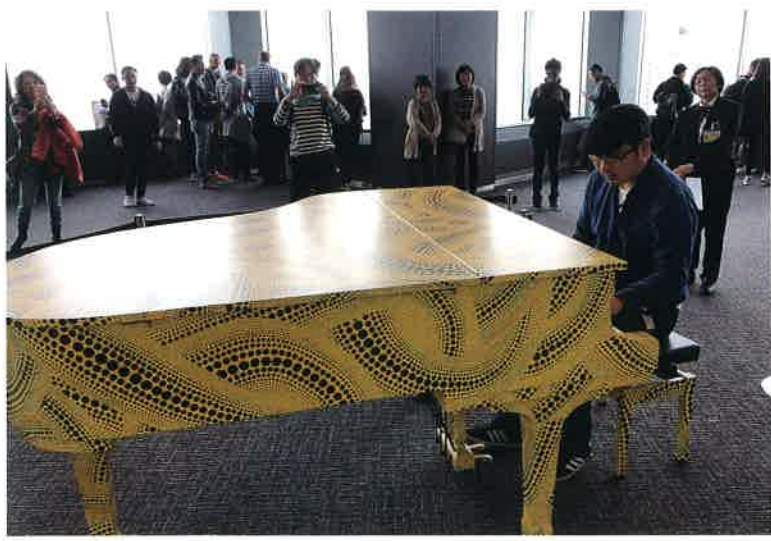
東京都庁の展望ロビーでピアノを弾き、注目を集めました(市村)