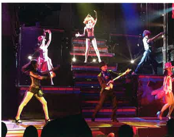
魅惑のニューハーフショーで 盛り上がり～ キャッホー!!