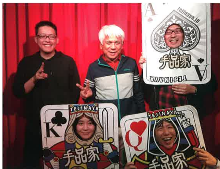
爆笑マジックを間近で見ました (新宿 手品家にて)

旅はいつでも！ ワールドバケーション 石川県金沢市堅町42-2 TEL 076-255-2000