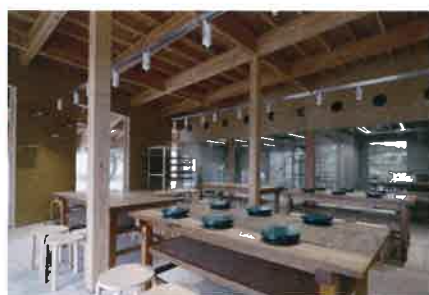
ろくろや絵付けを体験できる 工房もあります

九谷セラミック・ラボラトリー 石川県小松市若杉町ア91番地 TEL 0761-48-4235