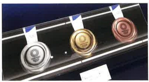
東京オリンピックのメダル (日本オリンピックミュージアムにて)