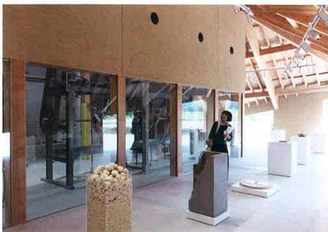
九谷焼の製造工程を見学できます