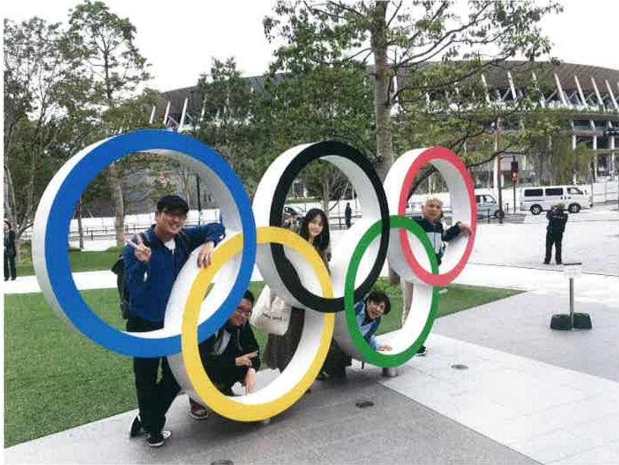
新国立競技場にて

あけましておめでとうございます！ 昨年も大変お世話になり、誠にありがとうございました。