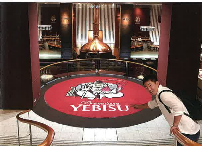
恵比寿のエビスビール記念館にて