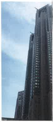
東京都庁もオ ムードでいっ