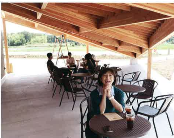
グリーンの屋根の下で一息