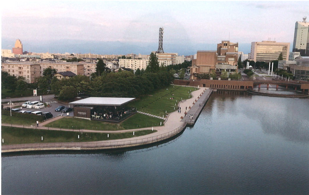
富山県：富岩運河環水公園 雲がなかったら立山連峰が見えたはず・・・