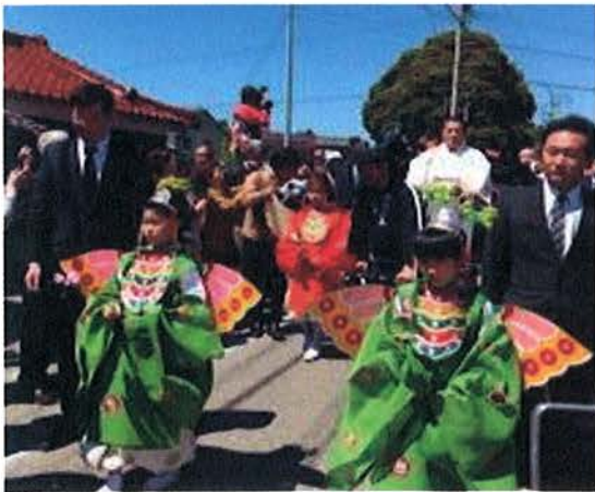
山門までつづく長い稚児行列。 先頭は松平健さんの人力車です