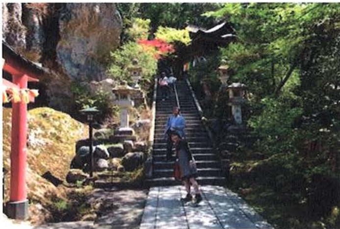
( 牧野 上西 )

思わず写真を撮りたくなるような美しいスポットがいっぱい！ 松尾芭蕉が那谷寺で詠んだ句 「石山の石より白し秋の風」は有名。 芭蕉になった気分で一句ひねりたくなります。